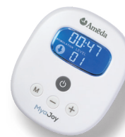
TIRE-LAIT MYA JOY