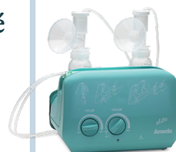
TIRE-LAIT AMEDA PLATINUM™