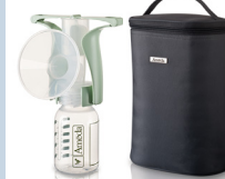
TIRE-LAIT À UNE MAIN AVEC FOURRE-TOUT