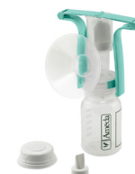
TIRE-LAIT MANUEL À UNE MAIN

Il s'agit de renseignements généraux qui ne remplacent pas les conseils de votre fournisseur de soins de santé. Si vous avez un problème que vous ne pouvez pas résoudre rapidement, demandez de l'aide sans tarder. Chaque bébé est différent. En cas de doute, communiquez avec votre médecin ou un autre professionnel de la santé.