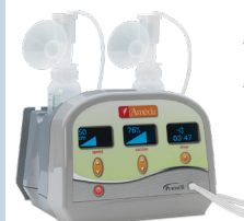
TIRE-LAIT AMEDA ELITE™